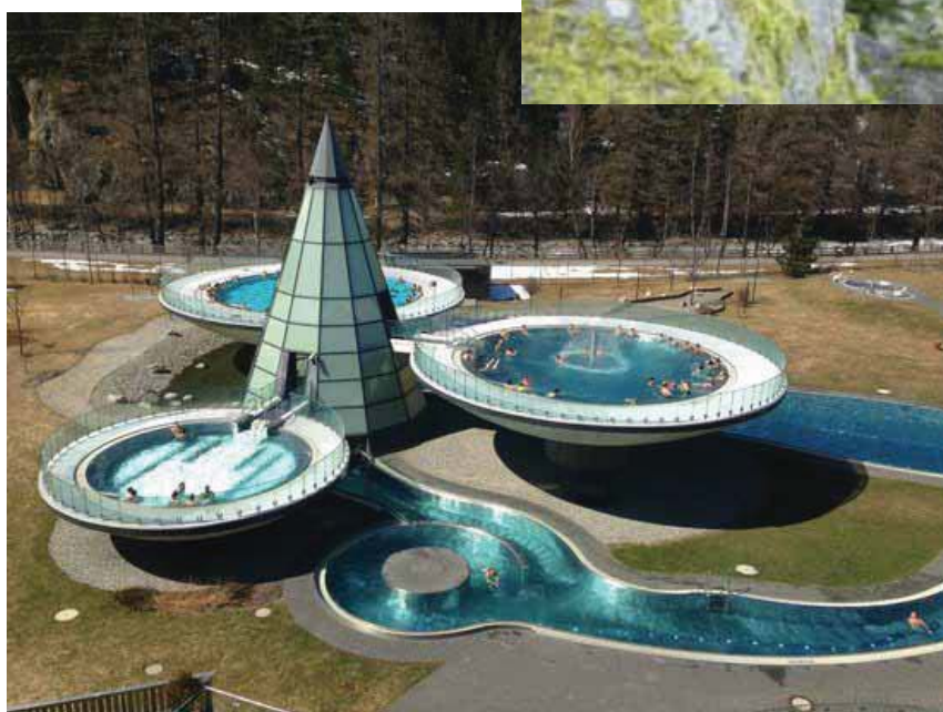
Therme Aqua Dom Längenfeld (27 km a nord di Obergurgl) Web: www.aqua-dome.at