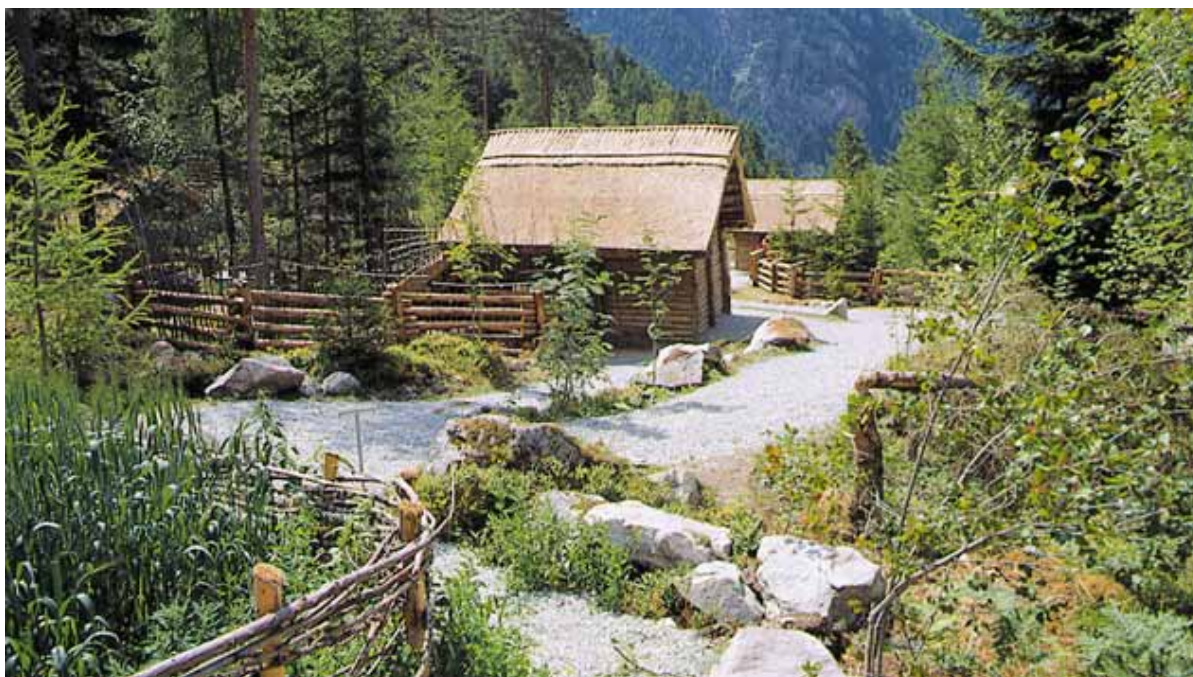
Ötzi-dorf Umhausen Villaggio dell'uomo del Similaun ( www.oetzi-dorf.at )