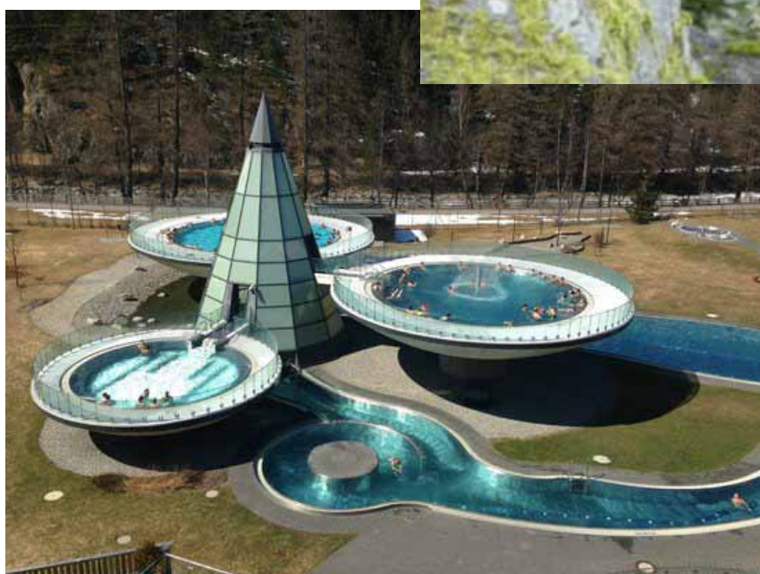
Therme Aqua Dom Längenfeld (27 km a nord di Obergurgl) Web: www.aqua-dome.at