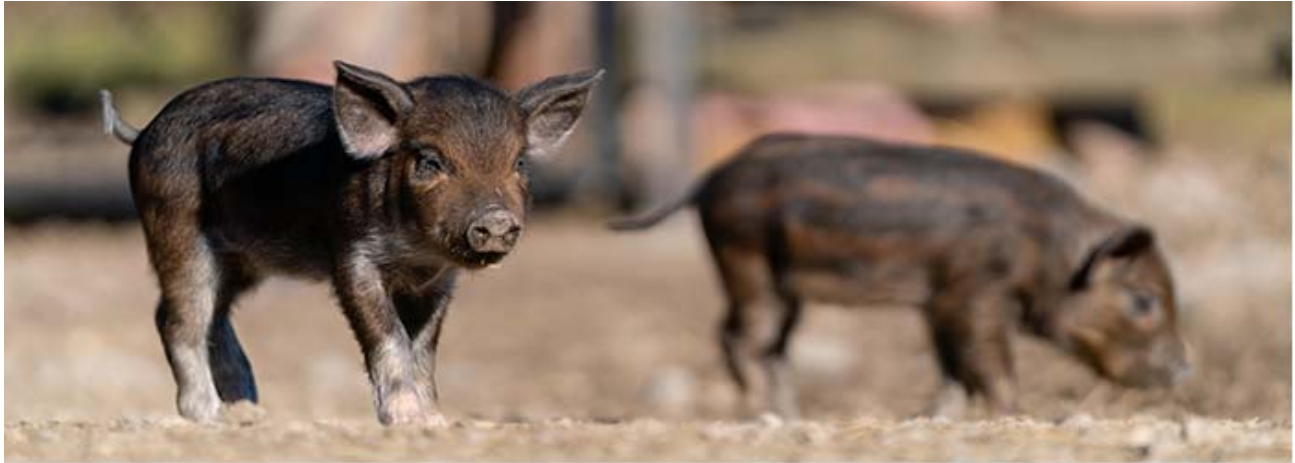
Erste Alpenschwein-Ferkel im Tierpark Goldau, Schweiz / Primi maialini alpini nel parco faunistico svizzero Goldau